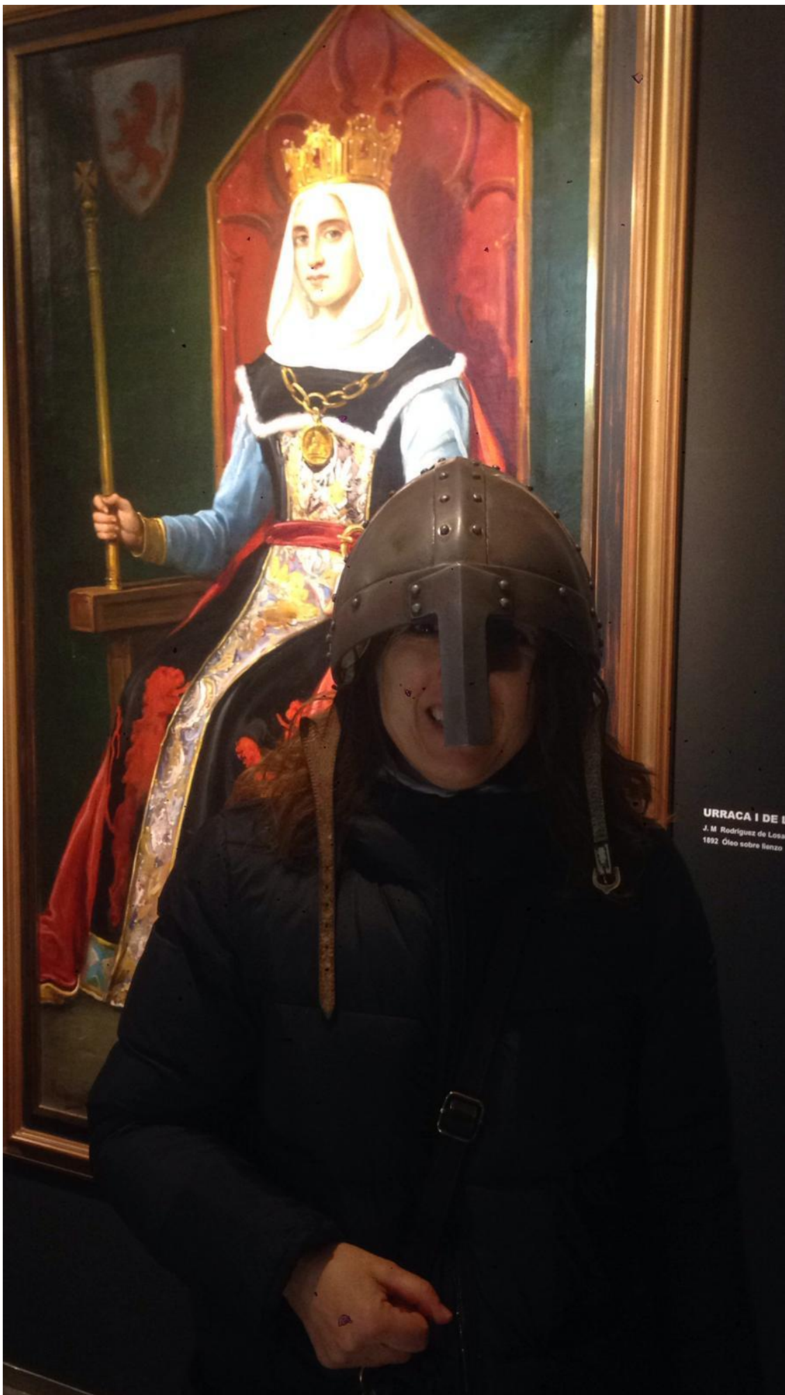
URRACA I DE L J. M. Rodríguez de Losa 1892 Óleo sobre lienzo