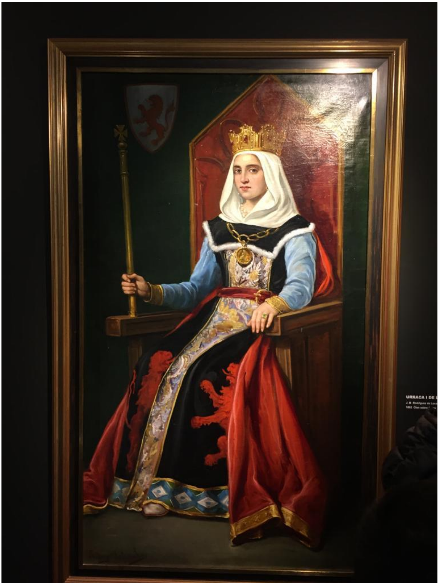
URRACA I DE J. M. Rodríguez de Lizaola 1892. Óleo sobre tela.